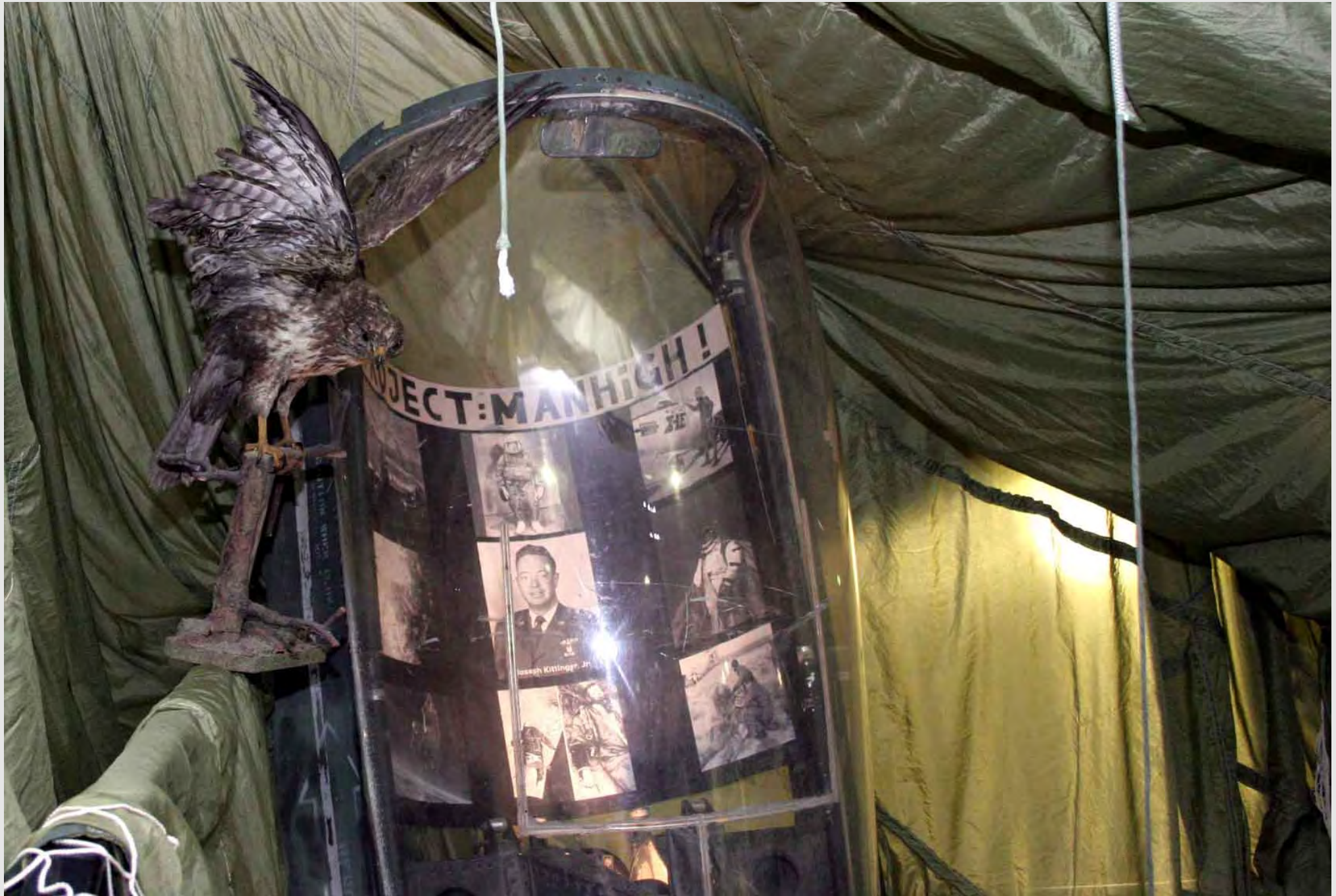
Der legendäre Fallschirmspringer im Dienste der NASA, Installation von Philip von den Benken