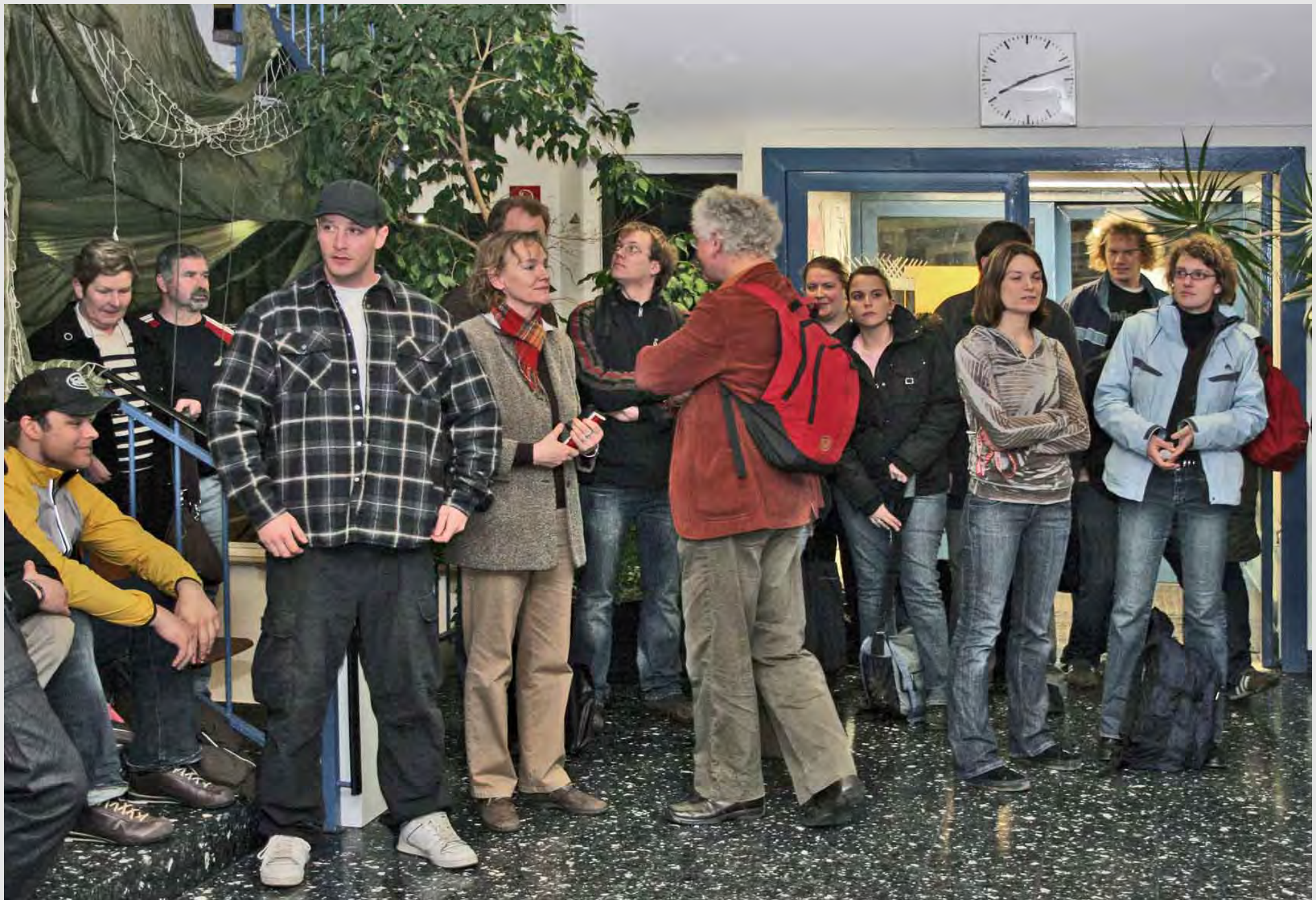
Das interessierte Publikum, eine breite Schulöffentlichkeit