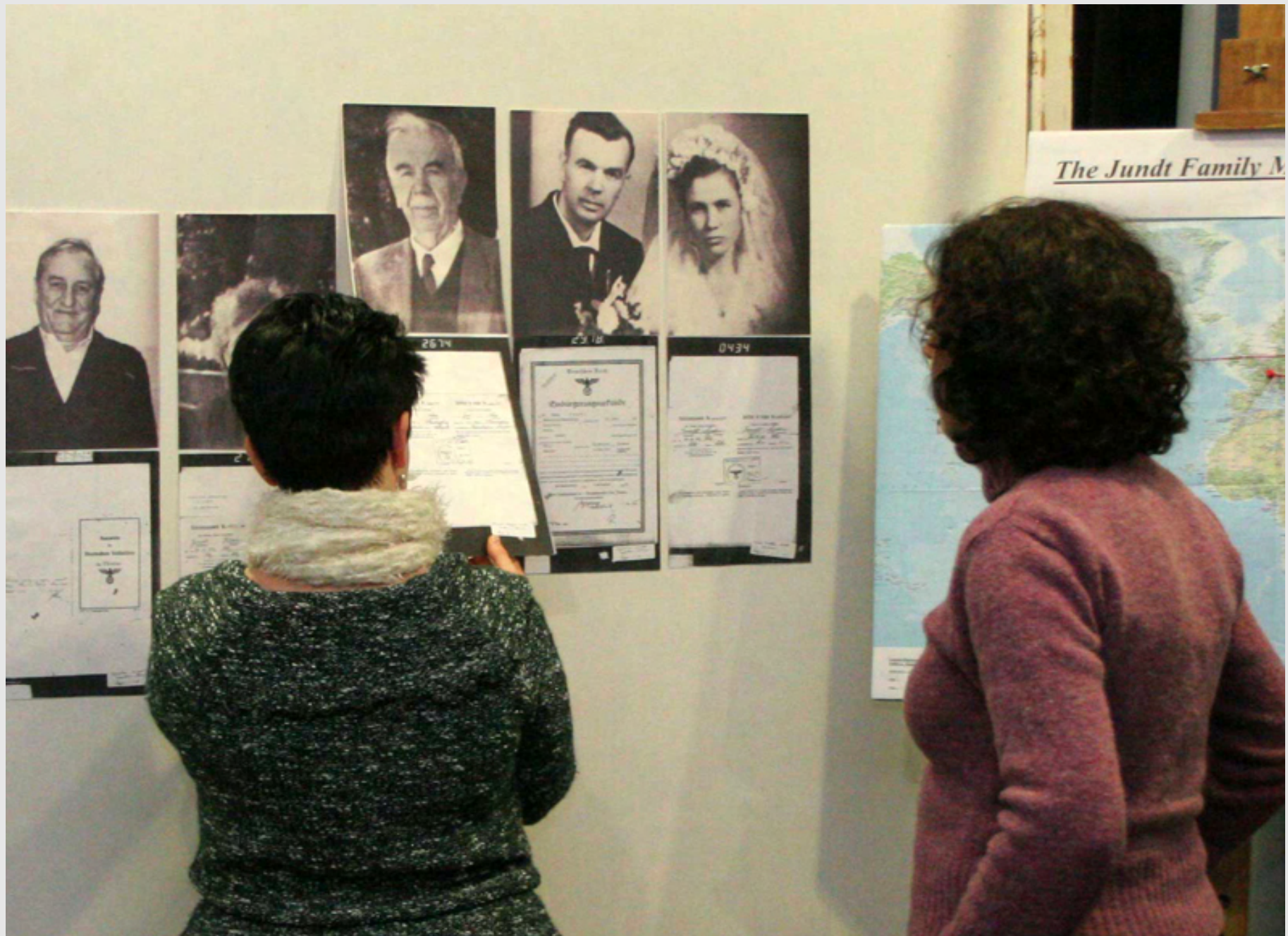
Stationen aus der Geschichte der Familie Jundt seit dem 18. Jahrhundert, dokumentiert von Valentina Kuhaupt