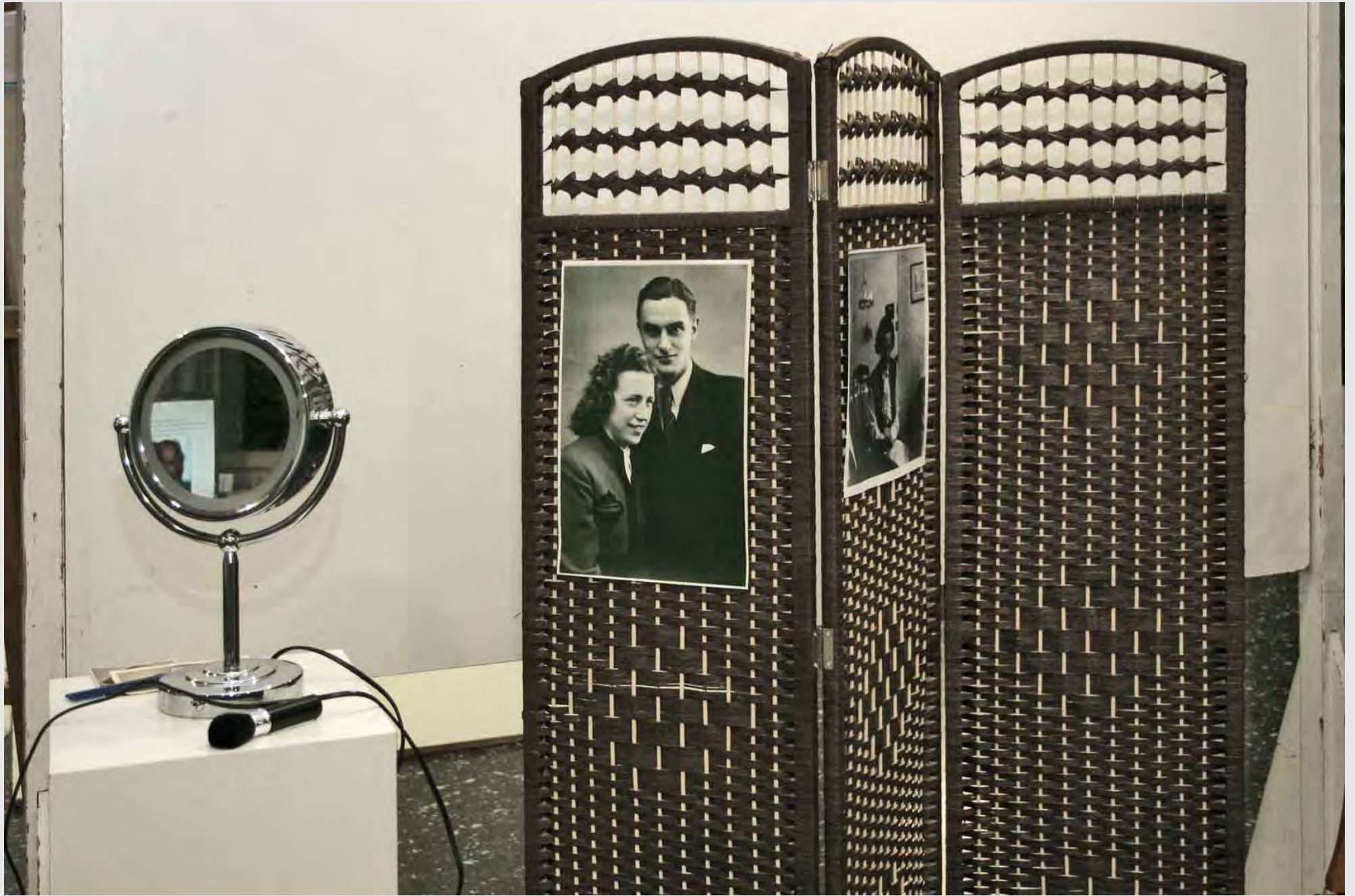
Improvisierter Friseursalon der Großmutter,