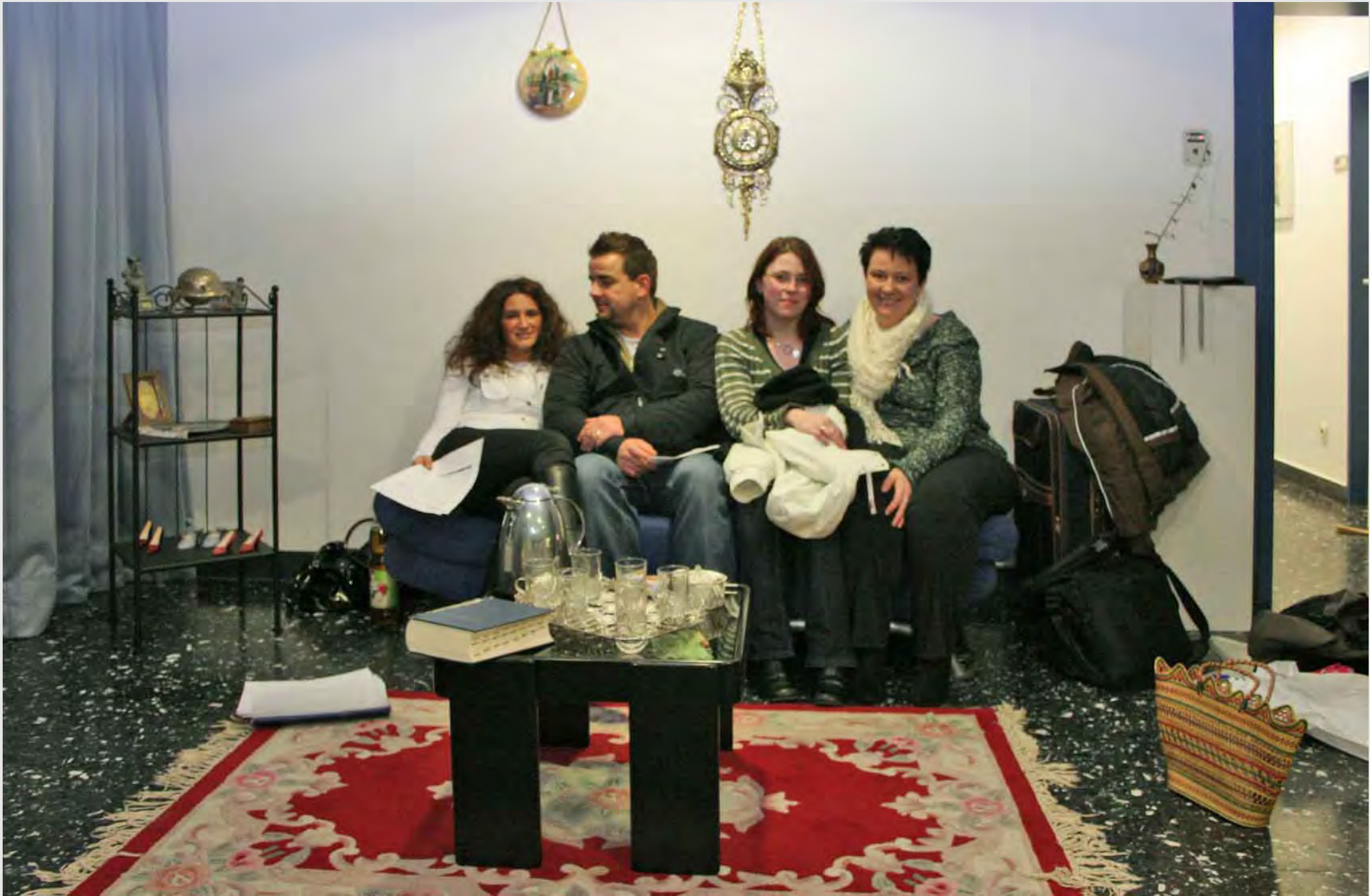
Die erste Wohnung meiner Mutter in Deutschland,