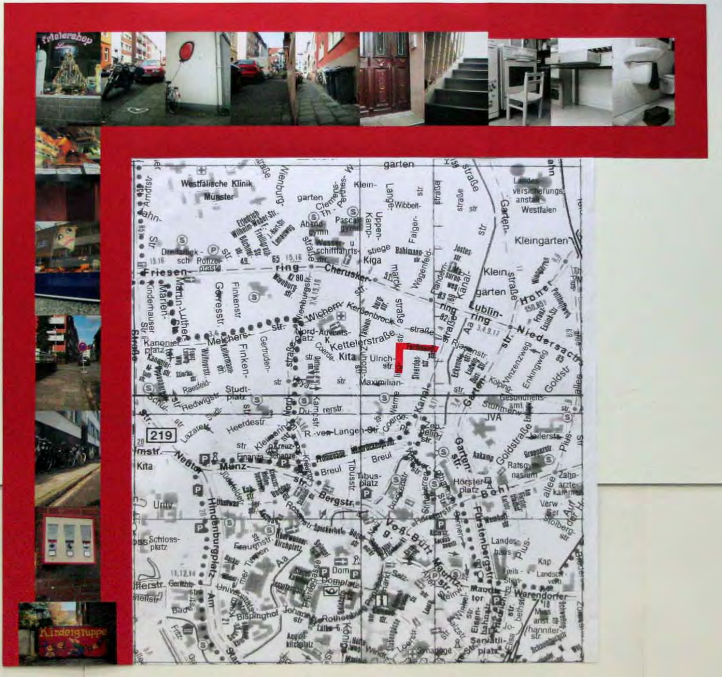
Der Weg zum Kindergarten, aus der Perspektive des Sohnes, fotografiert und illustriert von Lisa Hansmann